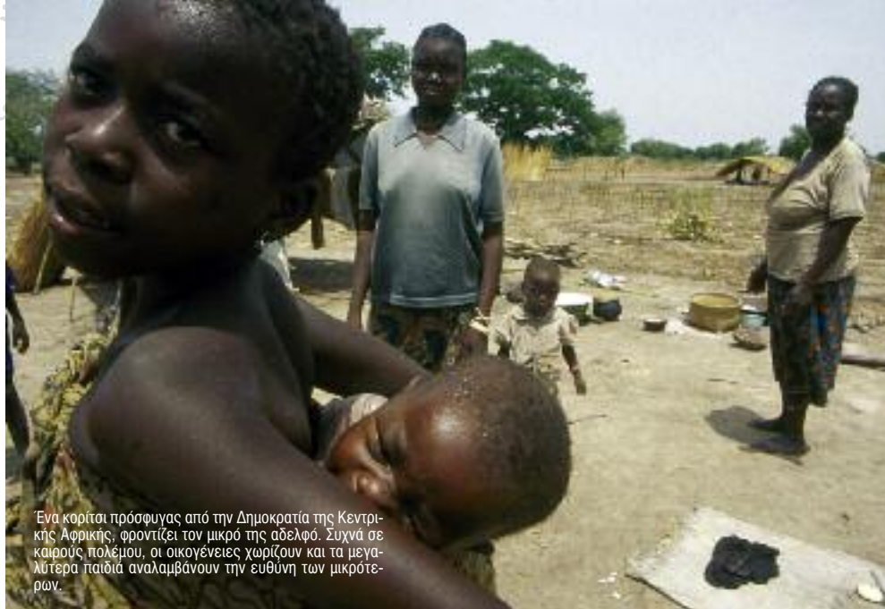
Ένα κορίτσι πρόσφυγας από την Δημοκρατία της Κεντρικής Αφρικής, φροντίζει τον μικρό της αδελφό. Συχνά σε καιρούς πολέμου, οι οικογένειες χωρίζουν και τα μεγαλύτερα παιδιά αναλαμβάνουν την ευθύνη των μικρότερων.

Τα ασυνόδευτα κορίτσια δεν πρέπει ποτέ να κρατούνται για λόγους που αφορούν μόνο στην παράνομη είσοδό τους στη χώρα 24 . Σύμφωνα με το Άρθρο 37(β) της Σύμβασης για τα Δικαιώματα του Παιδιού «Η σύλληψη, κράτηση ή φυλάκιση ενός παιδιού πρέπει να είναι σύμφωνη με το νόμο, να μην αποτελεί παρά ένα έσχατο μέτρο και να είναι της μικρότερης δυνατής χρονικής διάρκειας». Ο κανόνας αυτός επαναλαμβάνεται στο Άρθρο 32, παρ. 1, του Νόμου 3907/2011. Επιπλέον, το Άρθρο 13, παρ. 6, του Π.Δ. 114/2010 προβλέπει την αποφυγή της κράτησης ανηλίκων