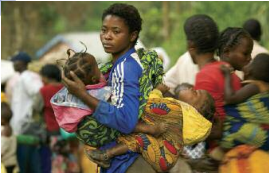
MONUC / Marie Fechain / September 2008

ται επαφές με οργανώσεις, συμπεριλαμβανομένων και ΜΚΟ, που έχουν εμπειρία στο χειρισμό θεμάτων που αφορούν σε ασυνόδευτα κορίτσια και στις ιδιαίτερες ανάγκες τους. Οι φορείς αυτοί μπορούν να παρέχουν εξειδικευμένη βοήθεια και να συμβάλλουν σε προσπάθειες σε εγχώριο και διεθνές επίπεδο για την αναζήτηση της οικογένειας των κοριτσιών και τις διαδικασίες οικογενειακής επανένωσης, όπου κρίνεται ως κατάλληλη βιώσιμη λύση και μόνο όταν δεν θέτει σε κίνδυνο το κορίτσι ή τα μέλη της οικογένειάς του. Η αναζήτηση της οικογένειας στηρίζεται στη συναίνεση που παρέχει το κορίτσι, αφού έχει ενημερωθεί σχετικά, και πρέπει να διέπεται από την αρχή της εμπιστευτικότητας.